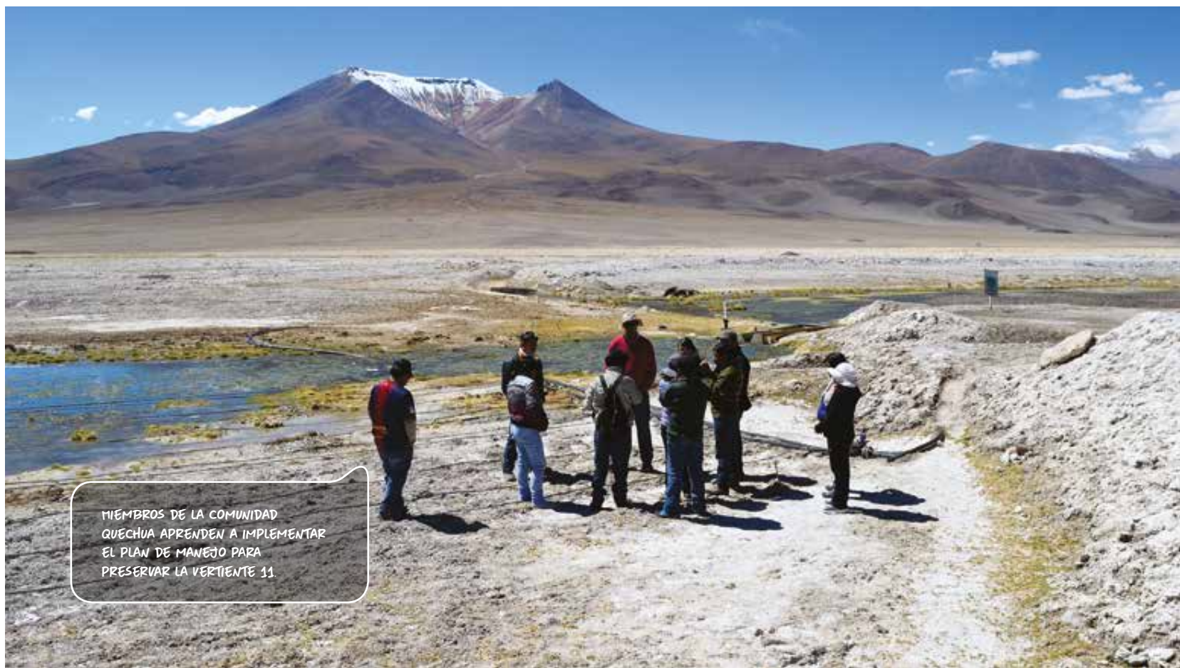
MIEMBROS DE LA COMUNIDAD QUECHUA APRENDEN A IMPLEMENTAR EL PLAN DE MANEJO PARA PRESERVAR LA VERTIENTE 11.

El convenio de colaboración destaca por promover el trabajo en equipo, donde la experiencia técnica de Minera El Abra y el conocimiento ancestral de la comunidad han resultado en un encuentro virtuoso para la preservación del entorno. En este trabajo se destaca además el programa de limpieza de la Vertiente 11, desarrollado por la Asociación Indígena de Cebollar-Ascotán.