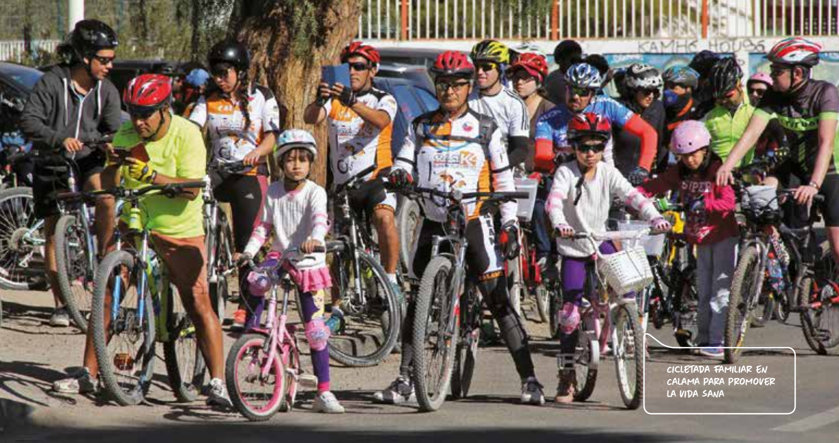
CICLETADA FAMILIAR EN CALAMA PARA PROMOVER LA VIDA SANA