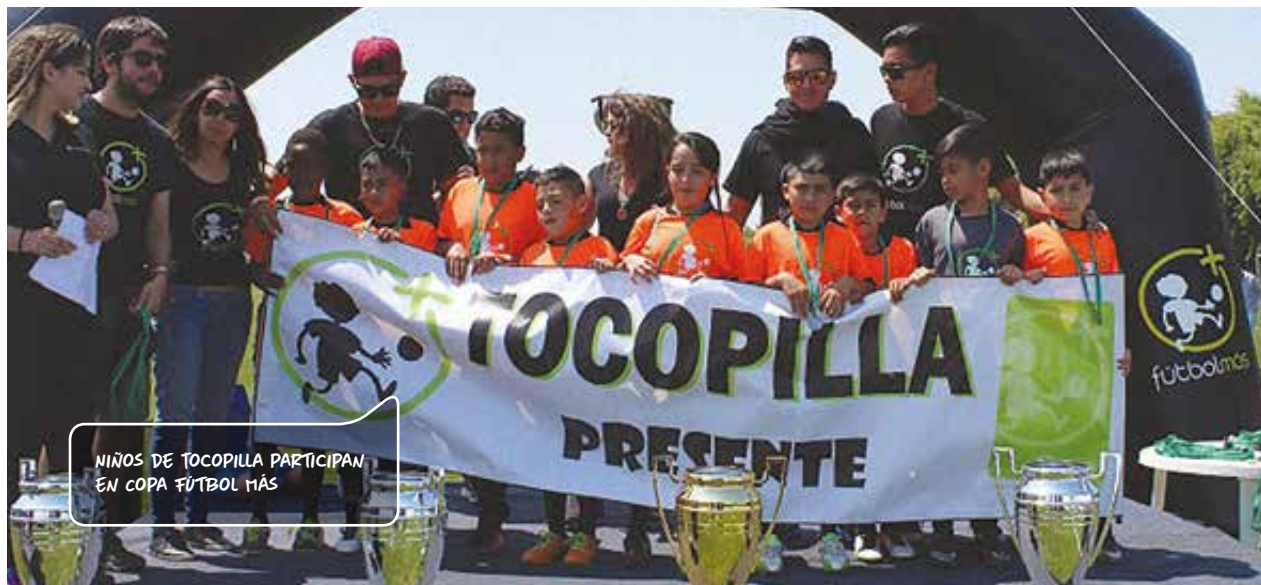
NIÑOS DE TOCOPILLA PARTICIPAN EN COPA FÚTBOL MÁS

El programa involucra la realización de talleres socio-deportivos que utilizan el fútbol como herramienta para transmitir valores y ofrecer a los más de 300 niños y niñas que participan de la iniciativa en esta localidad, espacios seguros para la recreación. Psicólogos, profesores y apoderados organizan distintas actividades como ligas inter-barriales, campeonatos y celebraciones. Fútbol Más es un programa internacional con ocho años de existencia, presente en seis países.