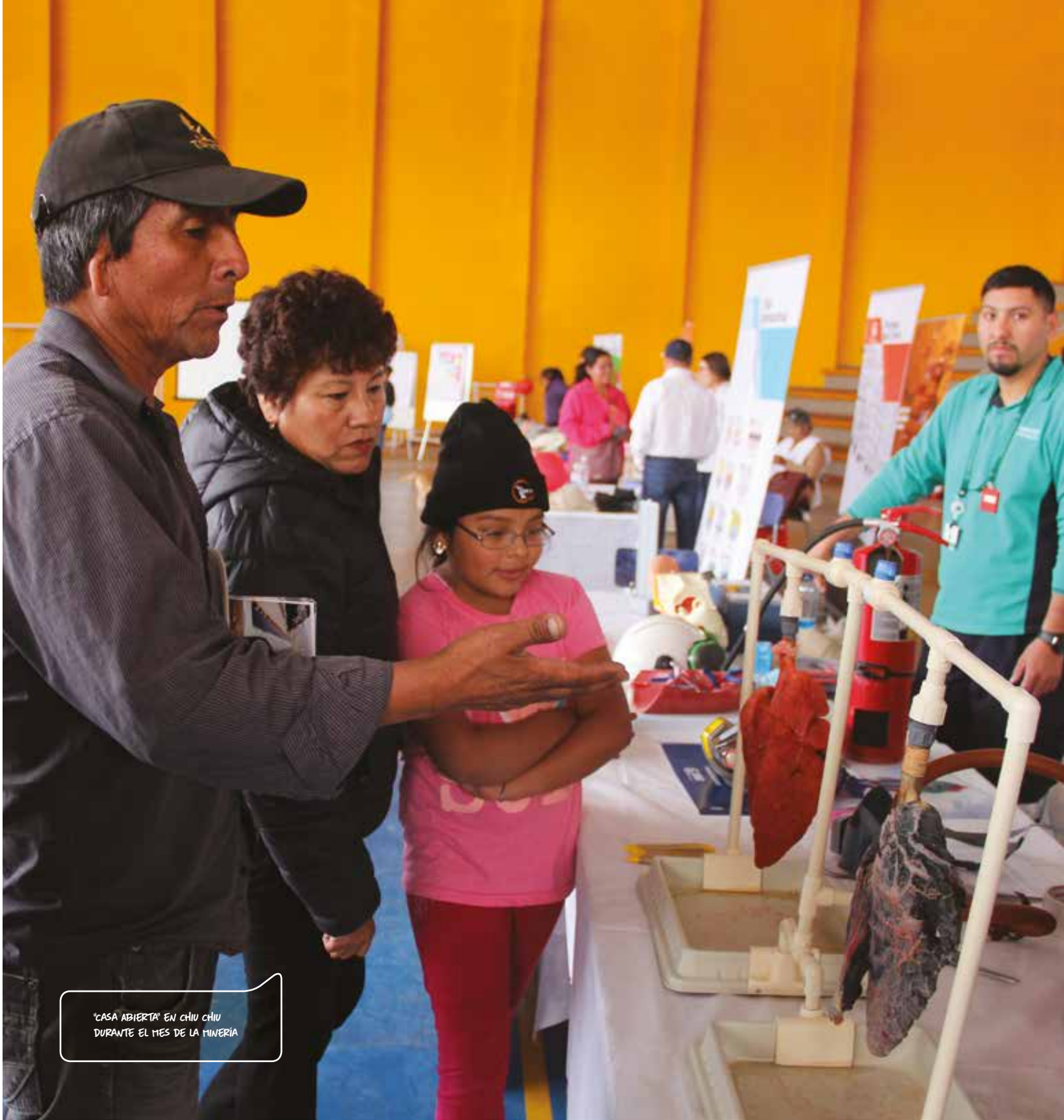
"CASA ABIERTA" EN CHIU CHIU DURANTE EL MES DE LA MINERÍA