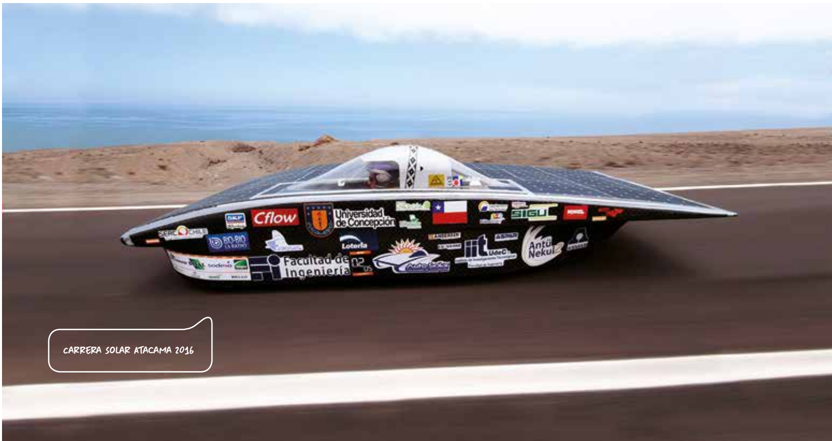
CARRERA SOLAR ATACAMA 2016

Por otro lado, se llevó a cabo un plan específico de limpieza del vertedero Lasana y se mantuvieron los retiros de residuos en las comunidades de Taira y Conchi Viejo.